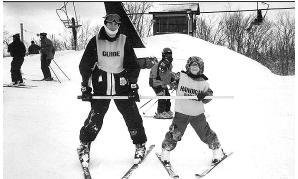
Des guides spécialisés s'occupent des jeunes lors des activités de ski.

Les Ailes de l'Espérance, 65 rue de Castelneau Ouest, bureau 404, Montréal. 514 277-5111 1 866 277-5111