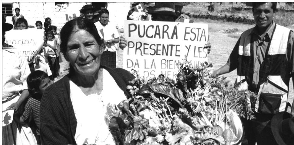
Avec l'arrivée de l'eau, la vie de cette paysanne a changé, comme en font foi les légumes qu'elle cultive maintenant à côté de sa maison.

Le manque d'eau potable étant le problème crucial au Pérou, 75 % des ressources servent à appuyer l'installation de systèmes d'eau potable fiables et permanents. Par exemple, à Tangoshiari en Amazonie il y a beaucoup d'eau, mais celle-ci est impropre à la consommation. Les enfants souffrent de maladies causées par l'utilisation de cette eau. Les ailes ont pu, grâce à l'appui des donateurs apporter une solution durable en installant un